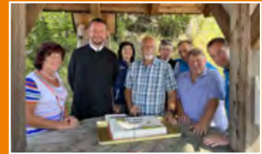
50. Geisbühelmesse, S.13