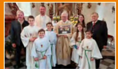
Goldenes Priesterjubiläum, S.18